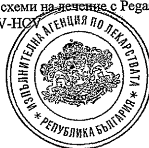
Таблица 4 представя преглед на безопасността при различните схеми на лечение с Pegasys в комбинация с рибавирин при пациенти с HCV и пациенти с HIV-HCV

При пациенти, едновременно инфектирани с HIV-HCV, профилът на клиничните нежелани събития, съобщени за Pegasys, приложен самостоятелно или в комбинация с рибавирин, е бил подобен на този, наблюдаван при пациентите, инфектирани само с HCV (вж. Таблицы 4 и 5). Лечението с Pegasys е било свързано с намаление на абсолютния брой на CD4+ клетки през първите 4 седмици без намаление на процента на CD4+ клетките. Намалението на броя на CD4+ клетките е било обратимо след намаление на дозата или преустановяване на терапията. Приложението на Pegasys не е имало забележимо отрицателно влияние върху контрола на HIV вирусната по време на терапията или в периода на проследяване. Данните относно пациентите с едновременна инфекция с брой на CD4+ клетките < 200/µl са ограничени (N = 31).