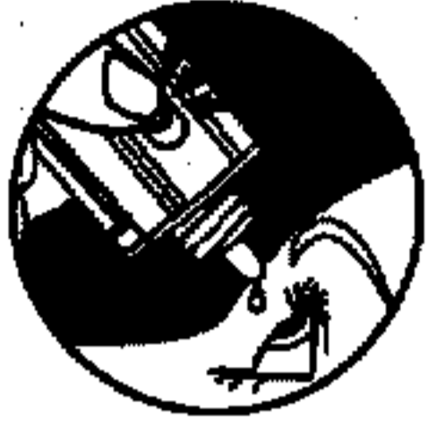
Област за натиск с пръст